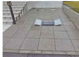
○住宅の勾配に合わせて製作。車の出入もらくらく!!